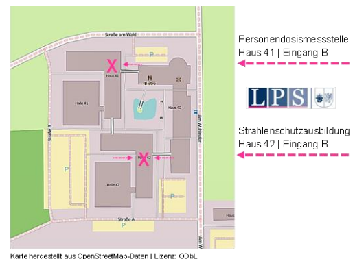
Ausschnitt vom Innovationspark Wuhlheide

Neben der langjährigen Erfahrung und der hohen fachlichen Qualifikation der wissenschaftlichen Mitarbeiter und technischen Assistenten, tragen eine moderne Geräte- und Raumausstattung in den Geschäftsräumen des Innovationsparks "Manfred von Ardenne" in Berlin Wuhlheide (IPW) dazu bei, dass die Auswertung von Dosimetern und die Ausbildung von Strahlenschutzfachkräften auf dem neuesten Stand von Wissenschaft und Technik erfolgt.