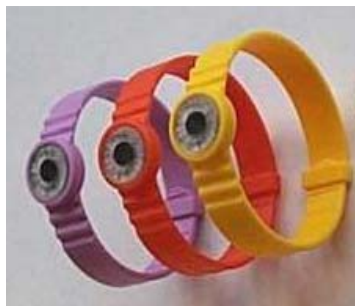
Abb. 1: Photonen-Fingerringe

Das dosimetrische Element ist eine runde TLD-Tablette aus LiF:Mg,Ti mit einem Durchmesser von 3 mm und einer Dicke von 0,38 mm. Neben dem Barcode ist die Dosimeternummer im Klartext angebracht, deren Lesbarkeit durch die Linse gewährleistet ist.